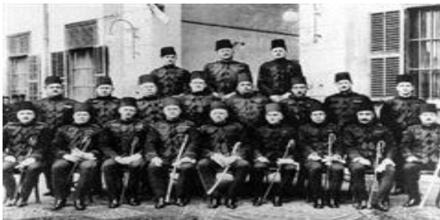
ضباط جهاز المخصوص